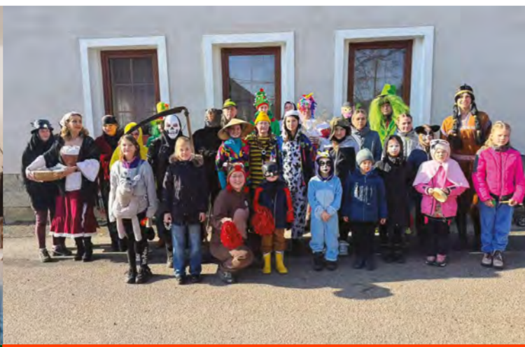
Lužany: Masopustní veselí