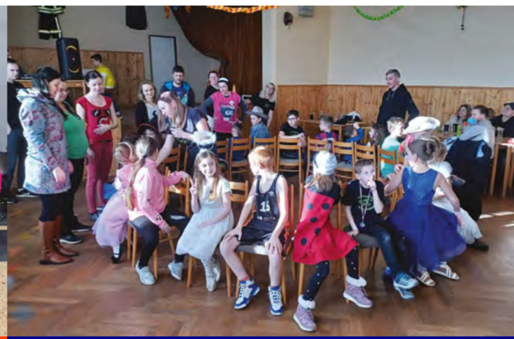
Račice nad Trotinou: Dětský maškarní bal