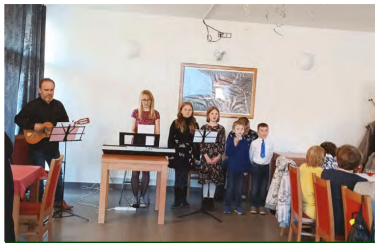
Habřina: Mezinárodní den žen v obci