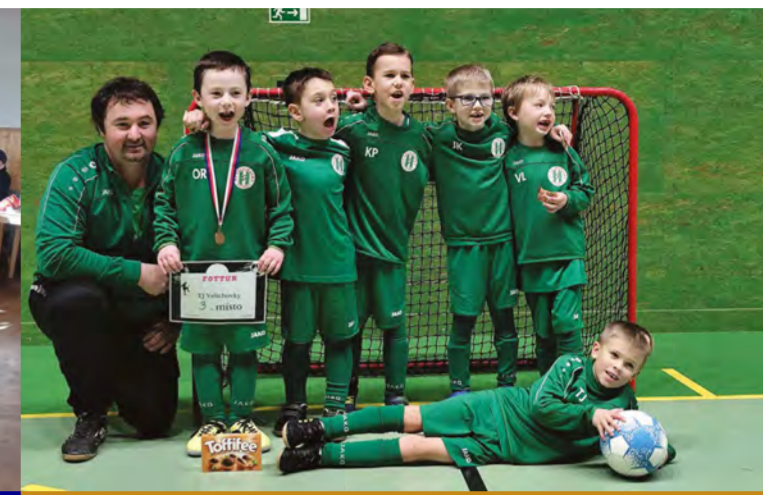
Velichovky: TJ Velichovky - zimní příprava a zápasy